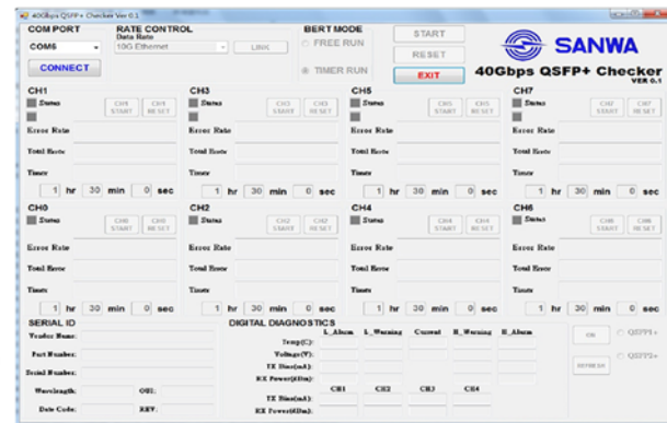
ソフトウェア画面(GUI)